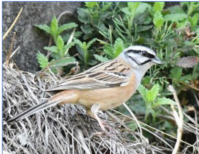
Abb. 1: Die Zippammer ist eine Charakterart der trockenwarmen Weinbauhänge und Felsfluren der Wachau, die das größte Vorkommen der Art in Österreich beherbergt. Teufelsmauer bei Spitz, 17.04.2018