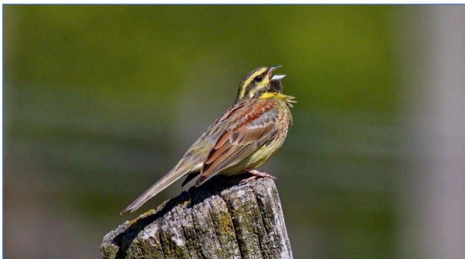
Abb. 2: Die Zaunammer, besiedelt seit wenigen Jahren die Wachau.